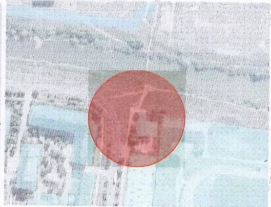
СХЕМА ФУНКЦІОНАЛЬНОГО ЗОНУВАННЯ ТА БЛАГОУСТРОЮ ТЕРИТОРІЇ ПО ВУЛ. ЧОРНОВОЛА У МІНЕТШИН ХМЕЛЬНИЦЬКОЇ ОБЛАСТІ